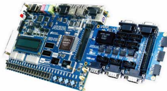
図2: Industrial Networking Kit

当社のパートナーである Terasic 社の Cyclone® IV FPGA ベースの開発キット、Industrial Networking Kit (INK) を使用すると簡単に産業用デザインを開始できます。このキットはネットワーキングのニーズに最適化されており、且つ FPGA 要件に対処できる柔軟性も備えます。